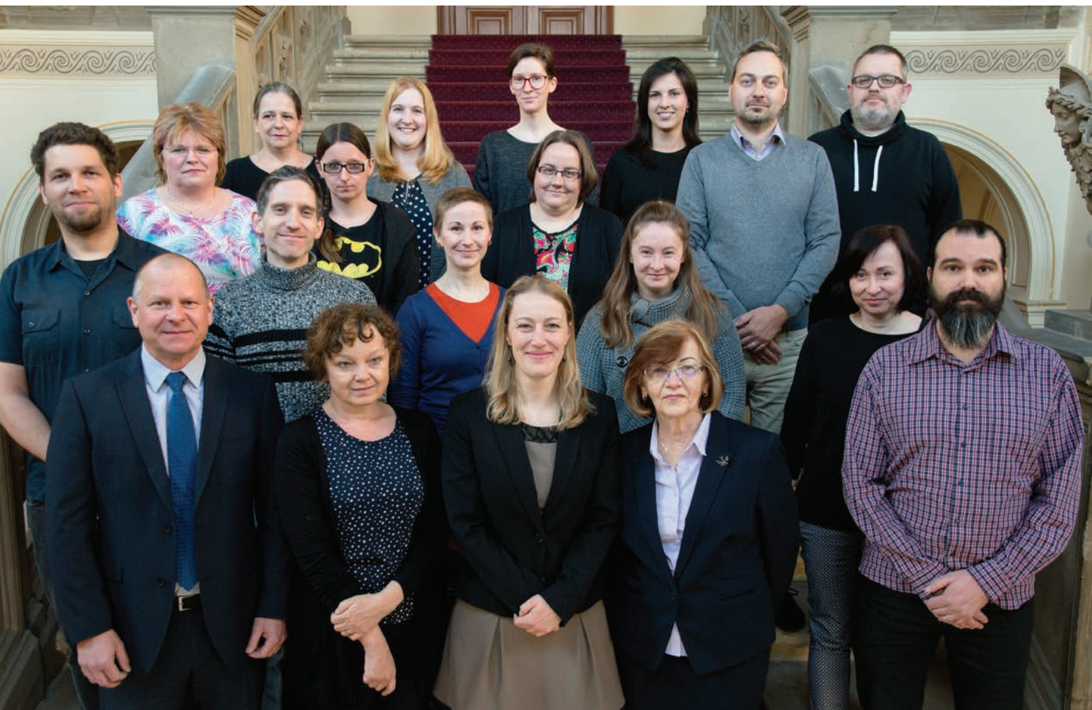
K 31. 12. 2018 Knihovna AV ČR zaměstnávala celkem 93 zaměstnanců. Na fotografii představujeme vedoucí odborů a oddělení KNAV. www.knav.cz/organizacni-struktura