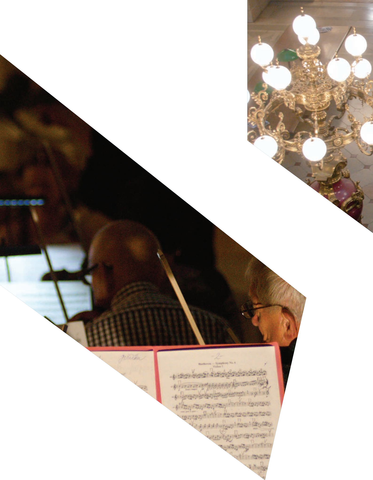
Návštěvníci Pražské muzejní noci si mohli už tradičně vychutnat koncert Komorního orchestru Akademie – tentokrát byla na programu Symfonie č. 6 F dur, op. 68 „Pastorální“ Ludwiga v. Beethovena.