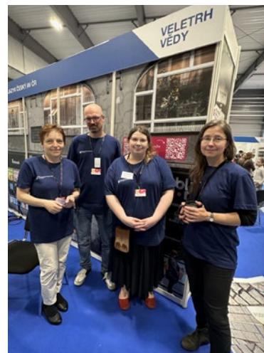
Pracovníci oddělení stylistiky a sociolingvistiky a oddělení onomastiky před expozicí ÚJČ na Veletru vědy