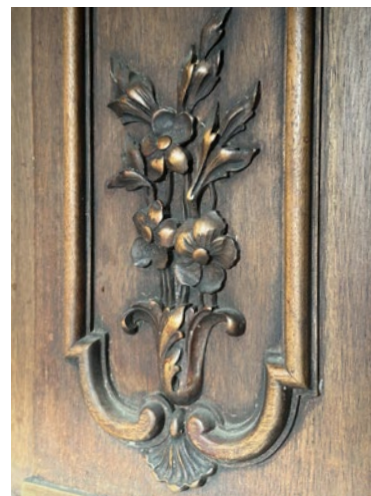
Detail původní výzdoby v budově Washingtonova

Na základě smlouvy o bezúplatném převodu vlastnického práva k nemovité věci s omezujícími podmínkami a o zřízení práva věcného , uzavřené mezi Ústavem pro jazyk český AV ČR, v. v. i., a Úřadem pro zastupování státu ve věcech majetkových (ÚZSVM) dne 26. 5. 2023, byla ÚZSVM dne 28. 1. 2025 zaslána Zpráva o plnění podmínek souvisejících s převodem ve veřejném zájmu za rok 2024 , která obsahuje závěr výpočtu skutečné míry hospodářského využití budovy Washingtonova 1569/21. ÚJČ v roce 2024 dosáhl výše hospodářského využití budovy 4,25 % a vyhověl podmínkám hospodářského využití majetku dle smlouvy. (Některé prostory v budově byly v roce 2024 pronajaty pro filmování.) V průběhu roku 2024 nebyla budova uvedena do stavu umožňujícího její užívání. Všechna pracoviště ÚJČ v daném období nadále sídlila ve stávajících pronajatých prostorách.