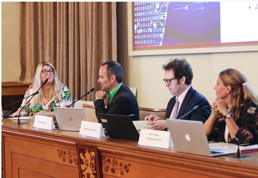
↑ Konference SOLAIR, 11. 9. 2025, Praha