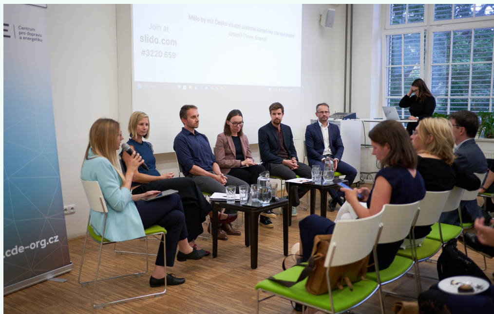
↓ Workshop „Od strategií k implementaci. Jak Česko naplní své klimatické cíle?“ 26. 9. 2024–26. 9. 2024, Praha. Dostupné z: https://www.cde-org.cz/cs/blog/od-strategii-k-implmentaci-jak-cesko-naplni-sve-klimaticke-cile/2544