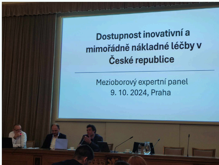
➤ Konference „Dostupnost inovativní a mimořádně nákladné léčby v ČR“, 9. 10. 2024, Praha