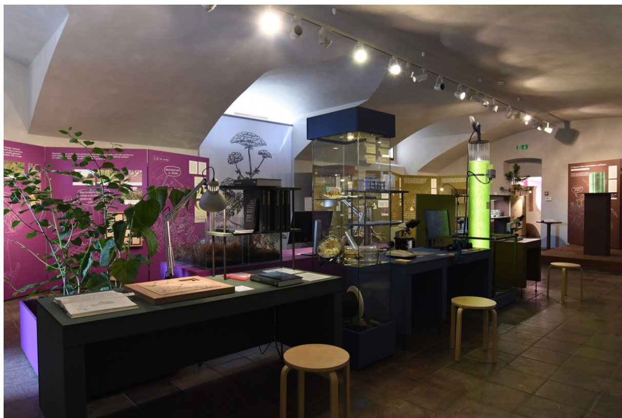
Obr.: Interiér výstavy „Botanické příběhy - svět rostlin od poznání k využití“

Nedílnou součástí činnosti pracovníků BÚ je popularizační a propagační činnost. Její nejvýznamnější akcí v roce 2015 byla Výstava „Botanické příběhy - svět rostlin od poznání k využití“, uspořádaná ve spolupráci s Ústavem experimentální botaniky AV ČR v rámci 125. výročí od založení České akademie císaře Františka Josefa pro vědy, slovesnost a umění, jež formou sedmi příběhů přiblížila současný botanický výzkum v Akademii věd. Výstava byla volně přístupná od konce dubna do září a měla i doprovodný program pro veřejnost: "vědecký trek" (30. 5.) a "vědecké dílny" (13. 9.). Doprovodné fotografie následují.