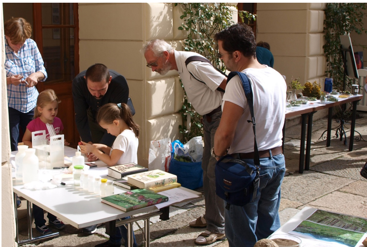
Obr.: Doprovodný program výstavy „Botanické příběhy - svět rostlin od poznání k využití“