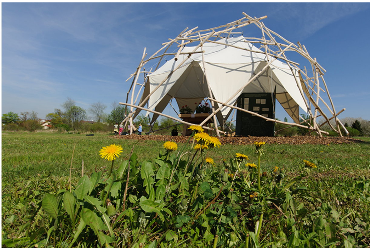
Obr.: Expozice výstavy „Botanické příběhy - svět rostlin od poznání k využití“ v exteriéru